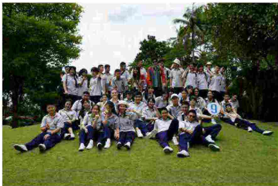
Un gruppo di studenti