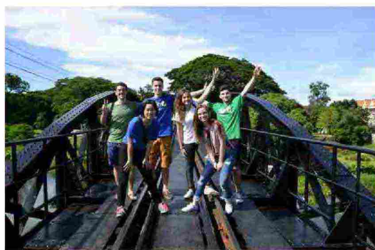
Alcuni studenti durante la loro esperienza all'estero

Trascorrere un periodo di studi all'estero senza perdere neanche un anno scolastico. E' possibile con Eurocultura che aprirà fino al 10 novembre il bando di concorso rivolto agli studenti delle scuole superiori per accedere a